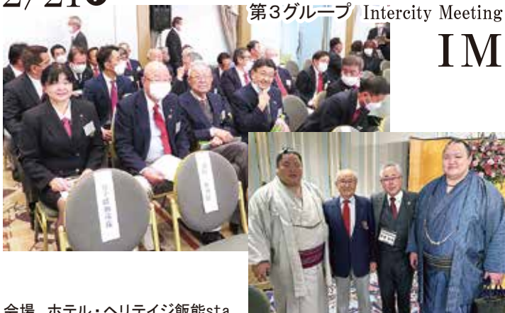
会場 ホテル・ヘリテージ飯能sta.