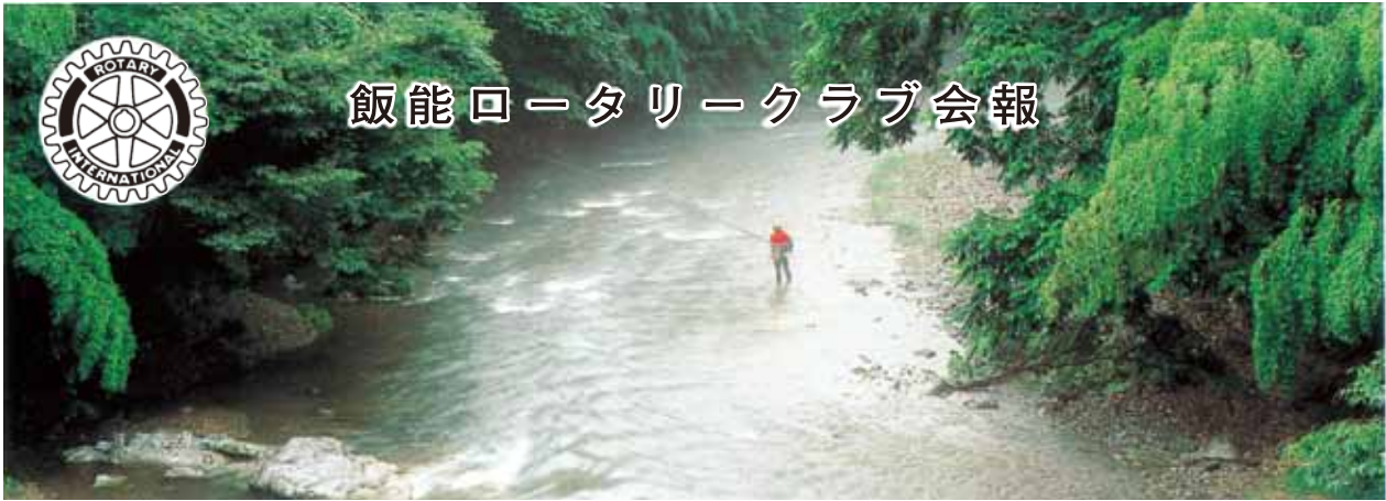
石原橋下の釣人 Fishing under the Ishihara bridge ...