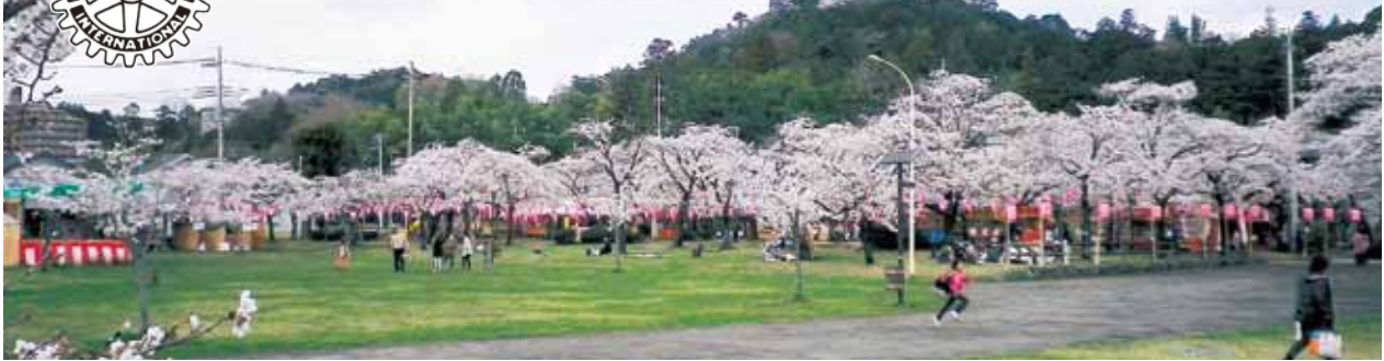
桜の中央公園と天覧山