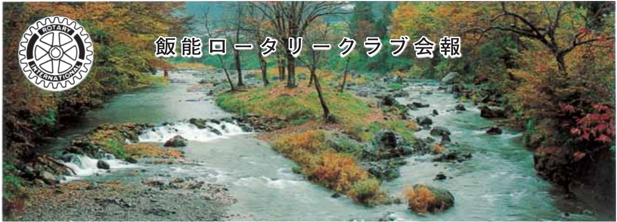
唐竹晩秋 Karatake in late autumn