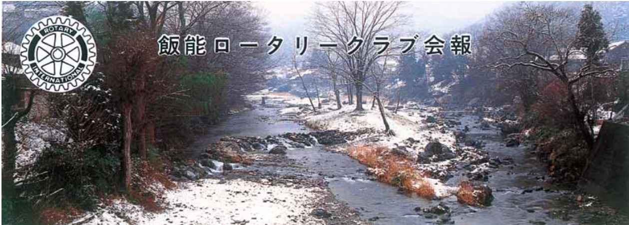
唐竹雪化粧 A coat of snow covers Karatake