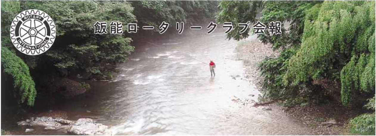
石原橋下の釣人 Fishing under the Ishihara bridge ...