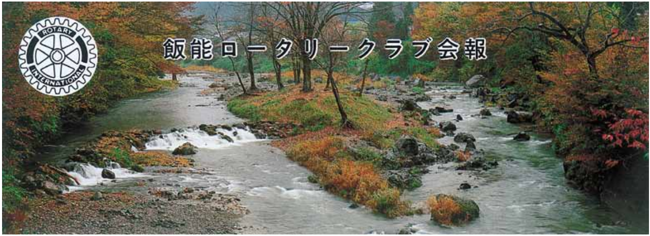
唐竹晩秋 Karatake in late autumn