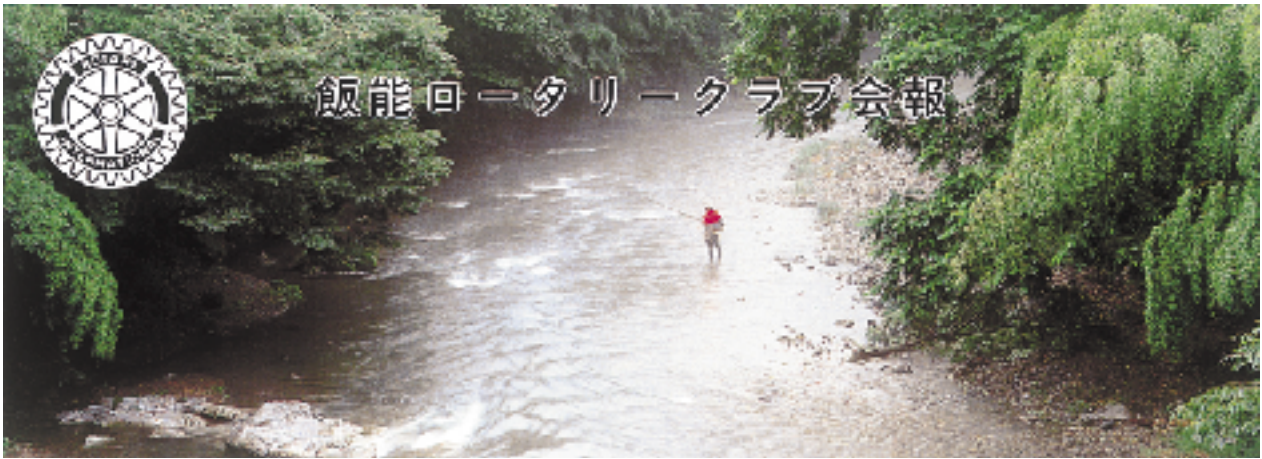
石原橋下の釣人 Fishing under the Ishihara bridge ...