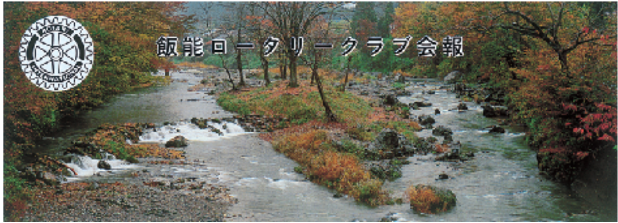
唐竹晩秋 Karatake in late autumn